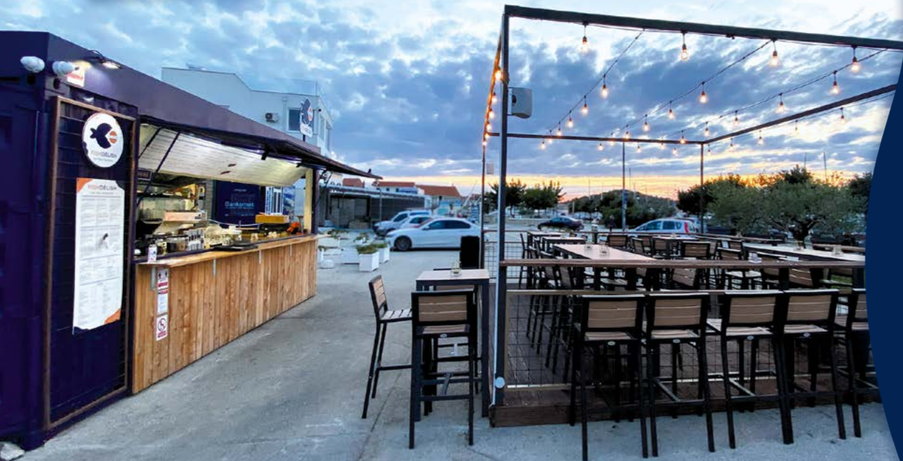
“Standalone” jedinica, lokacija: Murter, trg i šetnica