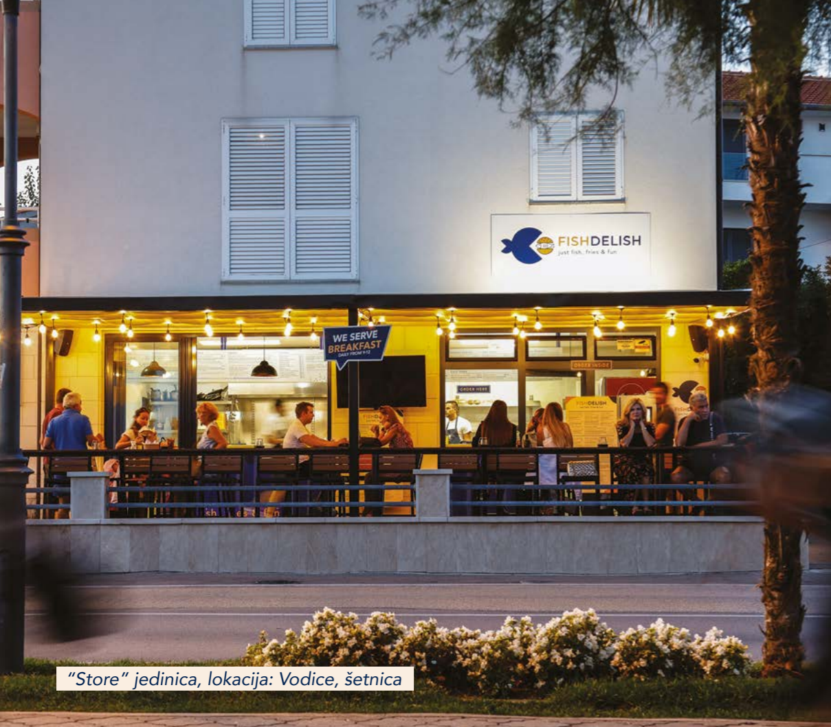
"Store" jedinica, lokacija: Vodice, šetnica