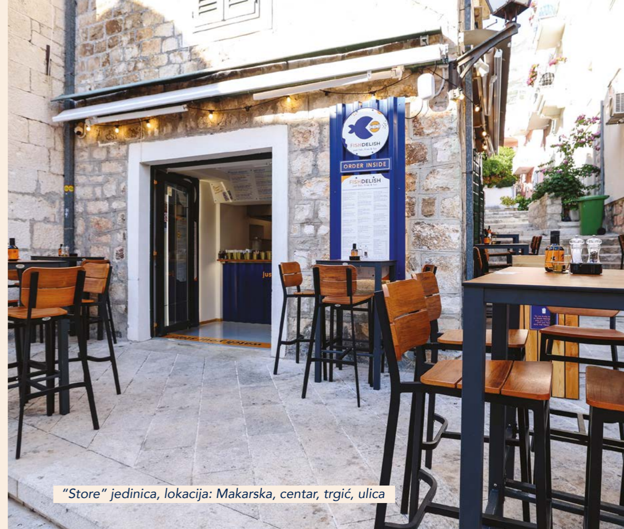
"Store" jedinica, lokacija: Makarska, centar, trgić, ulica