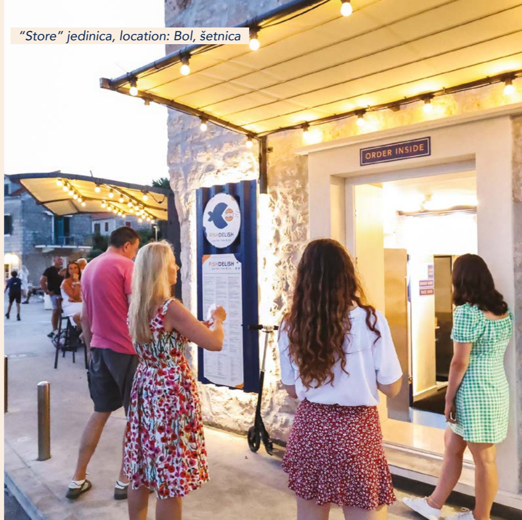
"Store" jedinica, location: Bol, šetnica