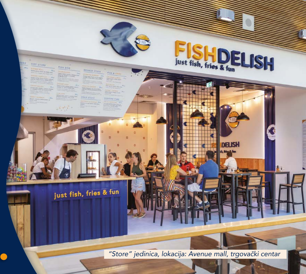
“Store” jedinica, lokacija: Avenue mall, trgovački centar

Prilagođen je većim turističkim središtima, mjestima i gradovima, kao i cjelodnevnom poslovanju, a sama ponuda jela proširena je na posebni segment doručaka.